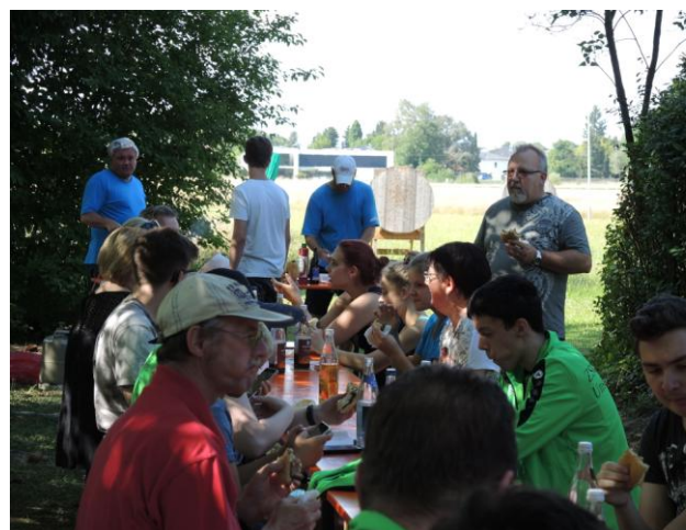
Bilder von der Preisverteilung